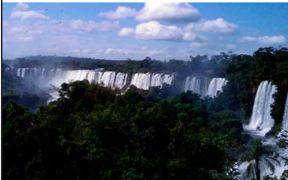
写真② イグアスの滝全体像。大小の滝の数を数えてみよう!