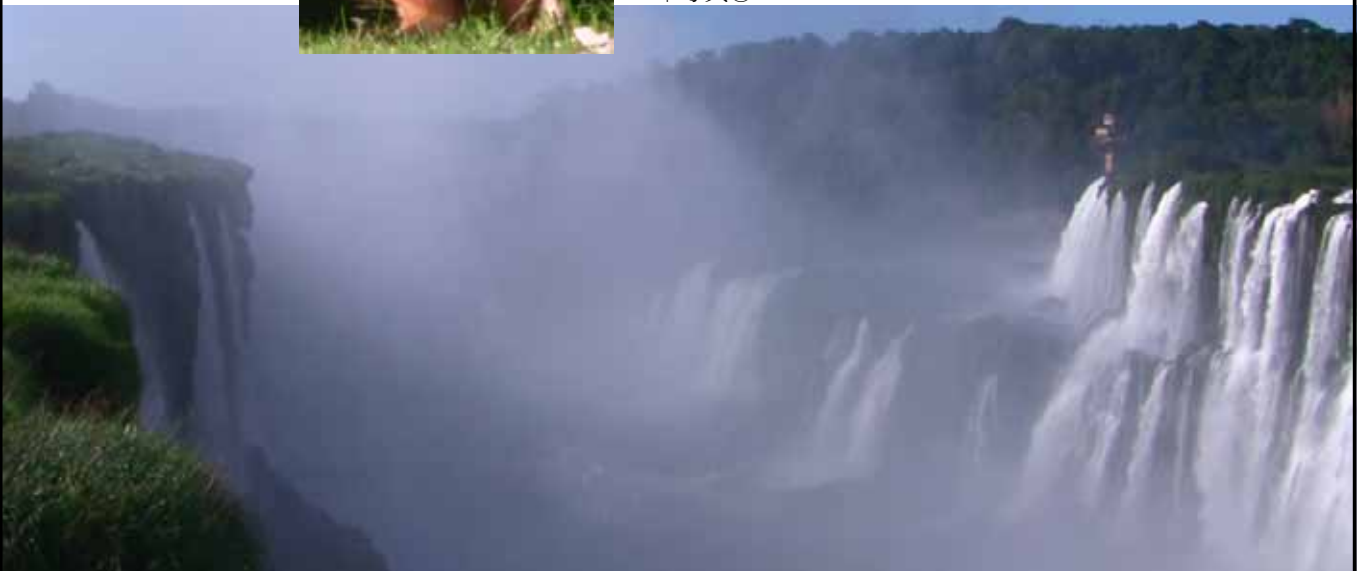
写真⑥ 275もの大小の滝が見られる大迫力のイグアスの滝。雲が空に昇っていきます。

イヌカタヌキかクマか？ 写真⑥の動物はなんでしょう か？イグアスの滝の周りは国立公 園になっていて、動物が自然のま ま保護されています。ユニークな