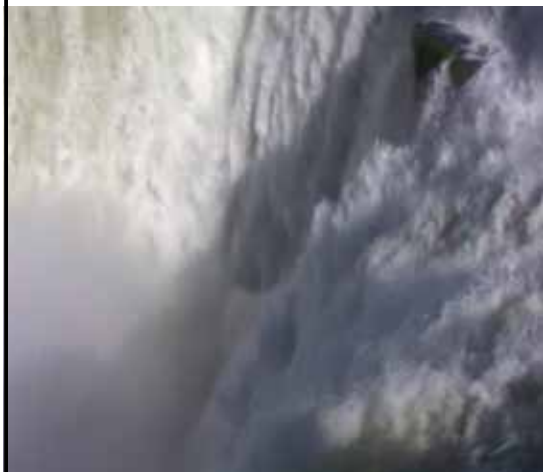
写真④ 悪魔の喉笛の最深部はどこか？

リカ・カナダ国境で、ビクトリアの滝はザンビア・ジンバブエ国境に位置します。 言ったものです。悪魔ののどぼとけではありません。 イグアスの滝の1日の水量はロンドンの年間消費水量に相当するそうです。