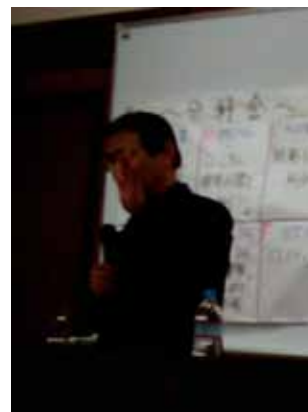
渡辺利夫 拓殖大学学長