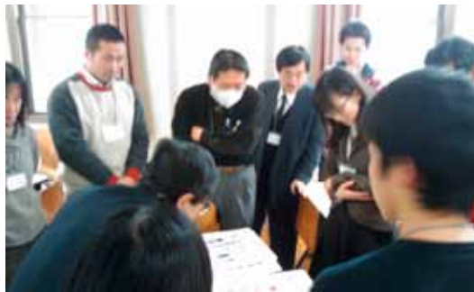
「おいしいチョコレートの真実」実践中

界貿易の問題についてワークショップを通じて学び、私たちが何ができるか考えるワークショップの教材です。